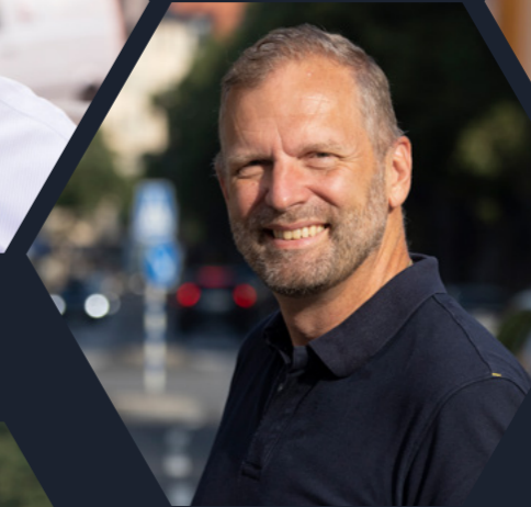
Klaus Silfvenius Bilhandel (ledamot i ARN)