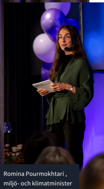
Romina Pourmokhtari, miljö- och klimatminister