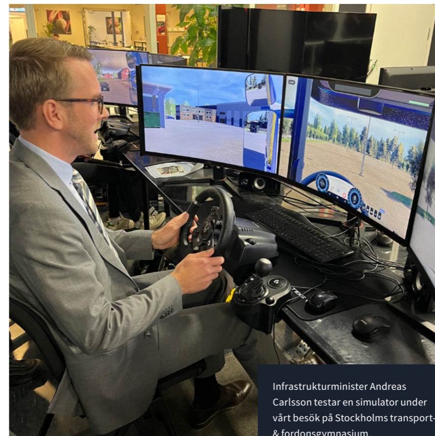
Infrastrukturminister Andreas Carlsson testar en simulator under vårt besök på Stockholms transport- & fordonsgymnasium.

Regeringen gav Transportstyrelsen i uppdrag att utreda och ta fram förslag till ändringar när det gäller datum för förbud mot att använda dubbdäck. Utgångspunkten för utredningen och förslagen ska vara att tiden då det är tillåtet att använda dubbdäck på våren förlängs med två veckor. Transportstyrelsen ska redovisa det nya regeringsuppdraget senast den 16 augusti 2024. Detta är en fråga som MRF lyft genom debattartiklar och ett